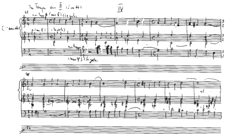
Erhalt uns, Herr, bei deinem Wort. Faksimile-Ausgabe