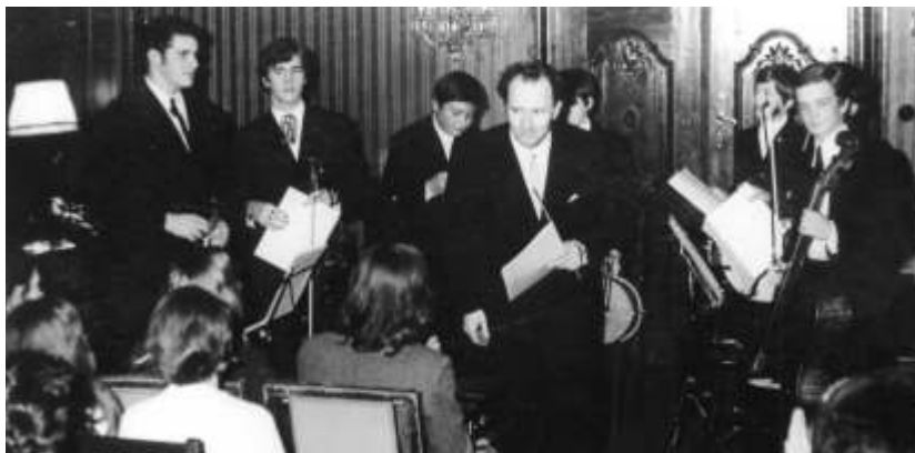
Uraufführung der Kleinen Tanzstücke in Doblingers Barocksalon (1970)

J 11 Kleine Tanzstücke für die Jugend. Fünf zyklisch oder einzeln spielbare Stücke für ein bis drei Melodieinstrumente und Schlagzeug ad lib. op. 66 (1970) / 8' Spielpartitur mit beigelegter Bassstimme UA 21. November 1970 Wien, Doblinger